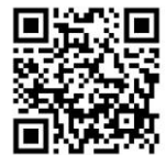
QR-Code เพื่อจองห้องพัก

โทรศัพท์: ๐๒-๔๒๒-๙๒๒๒ E-mail : rsvn@royalriverhotel.com