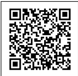
QR-Code เจ้าหน้าที

อาหารมุสลิม จำนวน.....คน อาหารทั่วไป จำนวน.....คน อาหารอื่น ๆ (โปรดระบุ) จำนวน.....คน