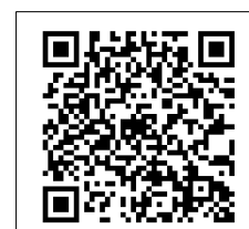
QR-Code เพื่อสอบถามข้อมูล