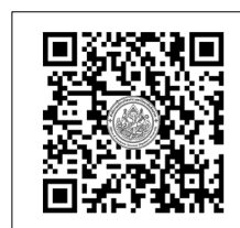
QR-Code เว็บไซต์